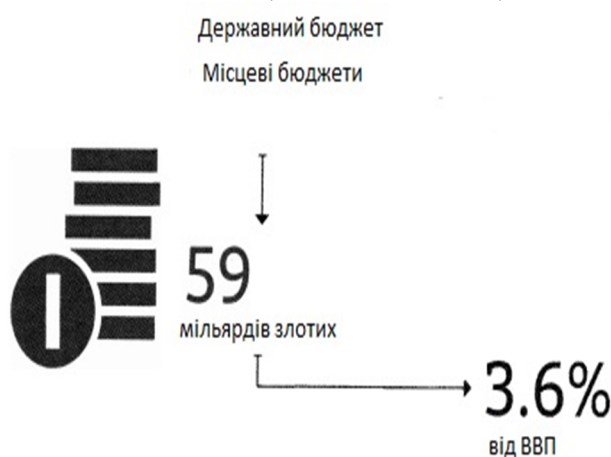
Рис. 2. Загальна сума витрат на шкільну освіту в Польщі (з державного та місцевих бюджетів) у 2013 році

Головним джерелом фінансування шкільної освіти в Польщі є дотації з державного бюджету. Величина щорічних дотацій щодо місцевих державних суб'єктів шкільної освіти зазначається в Бюджетному Акті ( Budżetary Act ), після чого Міністр освіти складає алгоритм розподілення цих коштів між місцевими державними суб'єктами освіти. Згідно з Актом про доходи об'єктів місцевого самоврядування керівні органи цих об'єктів приймають рішення про використання коштів, отриманих у межах загальної субвенції. Це означає, що органи місцевого самоврядування самостійно приймають рішення про розмір загальних витрат на шкільну освіту та її розподіл, зважаючи на власний дохід. Як шкільні керівні органи, вони, як правило, відповідальні за підготовку фінансових планів доходів та витрат щодо всіх навчальних закладів, які їм підпорядковуються. В умовах децентралізації владних повноважень органи місцевого самоврядування також регулюють розміри винагороди для вчителів, надання матеріальної допомоги школам та відповідають за інвестиції, визначають правила отримання та використання коштів школами. Кошти, визначені у фінансовому плані, надаються керівнику школи, який несе відповідальність за їх раціональне використання. Загальна сума витрат на шкільну освіту в Польщі (з державного та місцевих бюджетів) у 2013 році становила 59 мільярдів польських злотих, які становили 3,6 % від ВВП (рис. 2).