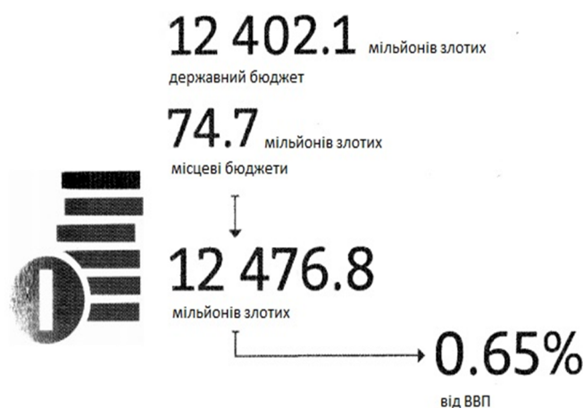
Рис. 3. Загальна сума витрат на вищу освіту в Польщі (з державного та місцевих бюджетів) у 2012 році

ктурі річних витрат на вищу освіту. Витрати на науково-дослідну діяльність можуть включати: фінансування наукових інститутів та/або фінансування певних проектів, які залежать від інституційних умов країн-членів Європейського простору вищої освіти. Так, наприклад, у Швейцарії витрати на науково-дослідну діяльність у 2011 році становили половину загальних витрат на вищу освіту та були на рівні 0,7 % від ВВП (загальні річні державні витрати на вищу освіту становили 1,37 % від ВВП). Інші країни-члени Європейського простору вищої освіти, такі як Швеція (0,69 % від ВВП), Фінляндія (0,62 % від ВВП), Естонія (0,55 %) та Нідерланди (0,52 %), також демонструють достатньо високу інтенсивність розвитку науково-дослідної діяльності. У цих країнах державні витрати на базові та допоміжні послуги у сфері вищої освіти становлять близько половини річних державних витрат на вищу освіту [7, с. 37-38].