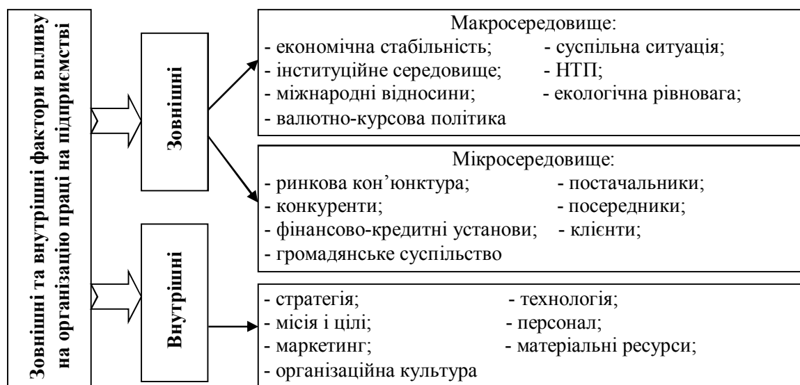
Рис. 1. Зовнішні та внутрішні фактори впливу на організацію праці на підприємстві

Зовнішні фактори впливу перебувають поза підприємством та існують незалежно від нього, але впливають або можуть у будь-який момент вплинути на його функціонування. Загальною рисою факторів зовнішнього середовища є не контрольованість їх з боку підприємства. Залежно від характеру впливу зовнішні фактори впливу на організацію праці на підприємстві можна поділити на дві групи: