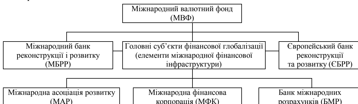
Рис. 3. Головні суб'єкти фінансової глобалізації

Міжнародні фінансові інституції, що у сукупності утворюють міжнародну фінансову інфраструктуру, численні та різноманітні. При загальній схожості змісту діяльності міжнародні фінансові інституції різняться за умовами членства в них, компетенцією, учасниками та повноваженнями. Найвідоміші суб'єкти фінансової глобалізації наведено на рис. 3.