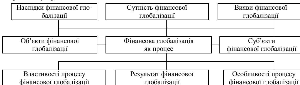
Рис. 1. Фінансова глобалізація: опис з позиції процесного підходу

Дескриптивну модель фінансової глобалізації наведено на рис. 1. Кожен з елементів дескриптивної моделі на рис. 1 у контексті дослідження, що проводиться, потребує різної уваги. Тому особливу увагу приділено тим елементам дескриптивної моделі фінансової глобалізації, які визнано важливими у дослідженні як вирішальної умови безпечного розвитку країни.