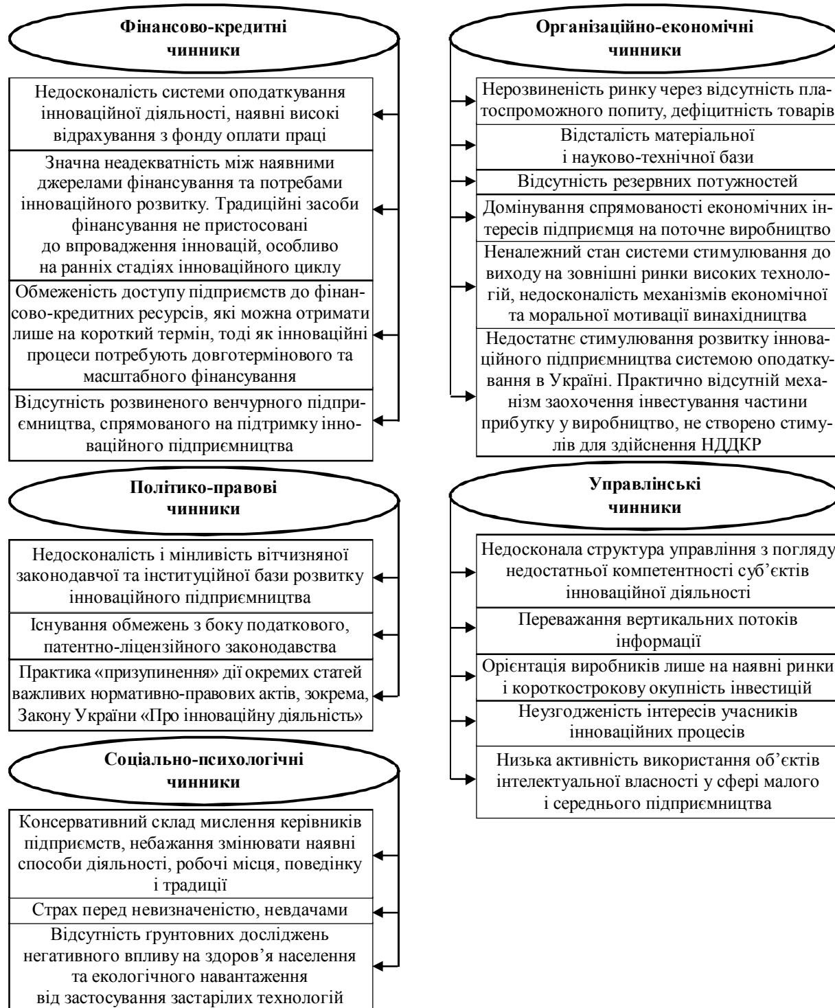
Рис. 3. Агреговані групи факторів стримування інноваційного розвитку легкої промисловості України

Безперечно, вітчизняна промисловість страждає від зазначених недоліків. Але, на нашу думку, головна причина криється у децю іншій площині. Йдеться про нерозвиненість інституційного середовища, яке мало б спрямовувати наявні фінансові та інформаційні потоки у пріоритетні для країни, а не окремих господарюючих суб'єктів, підприємницької сфери.