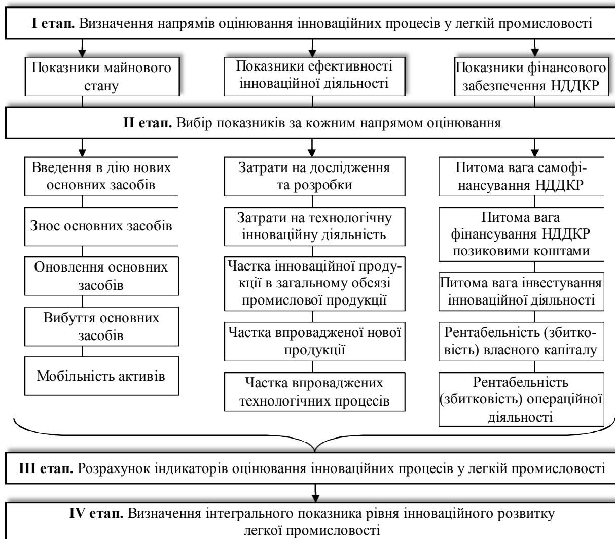
Рис. 1. Алгоритм оцінювання інноваційних процесів у легкій промисловості

Алгоритм визначення оцінки інноваційних процесів здійснюється в декілька етапів (рис. 1). Динаміка індикаторів оцінки інноваційного розвитку в легкій промисловості наведена в таблиці.