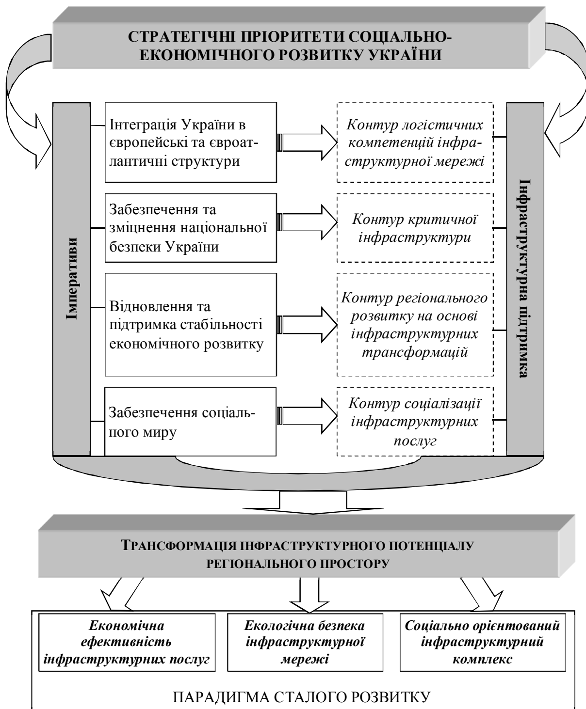
Рис. 2. Контури трансформації інфраструктурного потенціалу регіонального простору в контексті парадигми сталого розвитку

Об'єктивно обумовленою необхідністю нині є застосування принципово нового підходу до трансформації інфраструктурного потенціалу на регіональному рівні на основі формування ключових компетенцій. Передумовами запровадження концепції логістичної компетенції в межах трансформації інфраструктурного потенціалу регіону можна назвати: