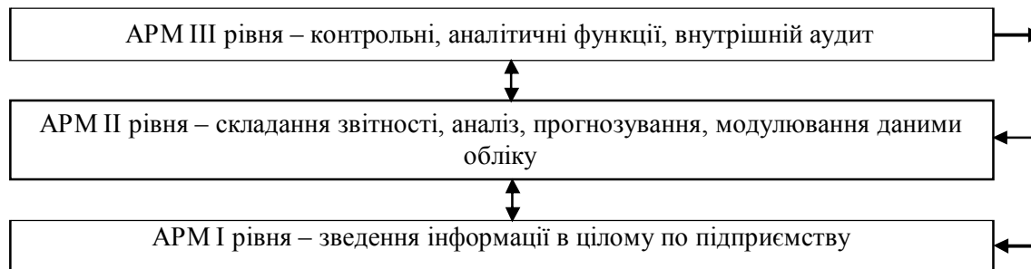
Рис. 2. Схема організації автоматизації основних засобів підприємства

На АРМ бухгалтера I рівня здійснюється формування зведеної інформації, підготовка даних для складання звітності. На АРМ бухгалтера II рівня проводиться складання звітності, здійснюється аналіз, прогнозування, моделювання даними обліку. На АРМ бухгалтера III рівня здійснюються контрольні, аналітичні функції, проводиться внутрішній аудит, приймаються управлінські рішення.