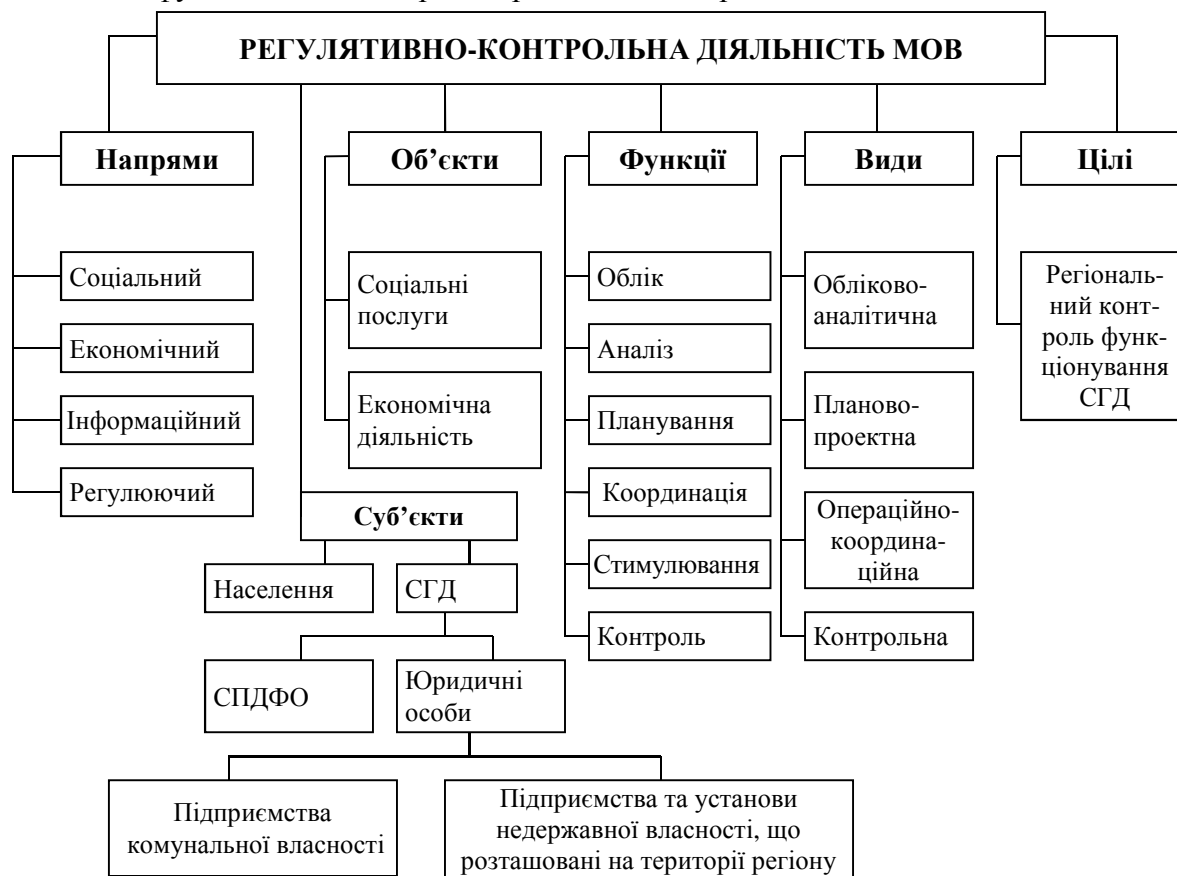
Рис. 2. Складники регуляторно-контрольної діяльності МОВ

Базові основи становлення та формування регуляторно-контрольної діяльності місцевих органів влади, зміст та структура компонентного складу як управлінського виду діяльності, функції, цілі та напрями представлені на рис. 2.