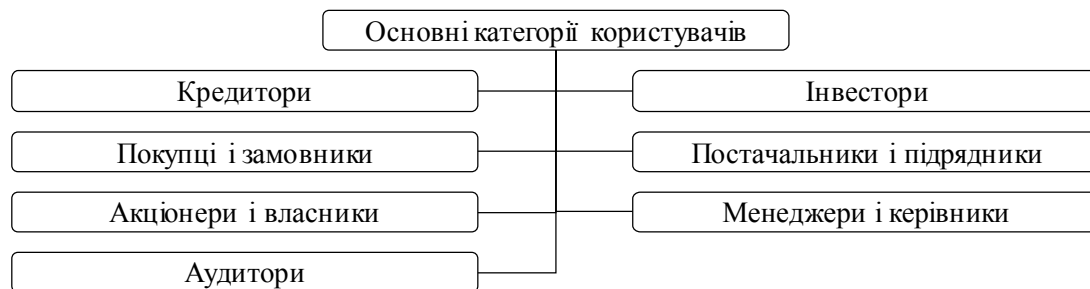
Рис. 1. Класифікація основних категорій користувачів інвестиційної інформації підприємства

Проте ми частково поділяємо думку вчених [5] щодо поділу суб'єктів інвестування. Вважаємо, що безпосередньо кожен учасник інвестиційного процесу прямо чи опосередковано впливає на нього і його участь є істотною та важливою. Тому ми підтримуємо думку інших науковців [6], які пропонують провести аналіз інвестиційної інформації залежно від основних категорій його користувачів та їх економічних інтересів (рис. 1).