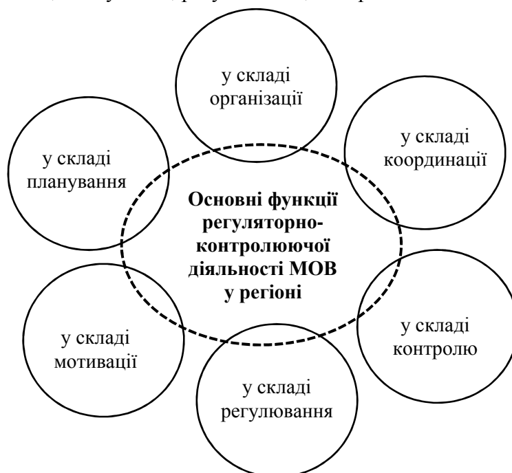
Рис. 1. Класифікація основних функцій регуляторно-контролюючої регіональної діяльності МОВ

Ґрунтуючись на наявних розробках [6] і акцентуючи увагу на соціально-економічній та фінансово-господарській діяльності на території, можна надати таку класифікацію основних функцій діяльності місцевих органів влади: у плані процесу організації, координації, планування, регулювання, контролю та мотивації (рис. 1).