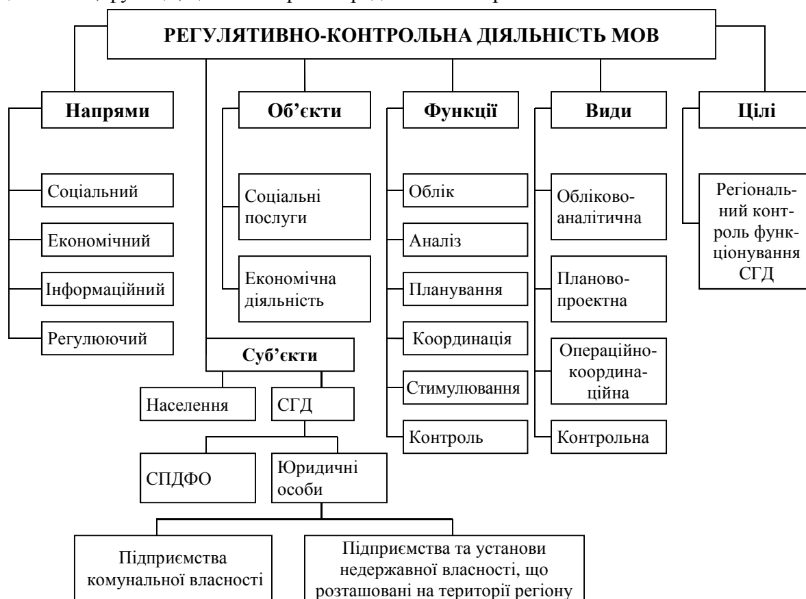
Рис. 2. Складники регуляторно-контрольної діяльності МОВ

Базові основи становлення та формування регуляторно-контрольної діяльності місцевих органів влади, зміст та структура компонентного складу як управлінського виду діяльності, функції, цілі та напрями представлені на рис. 2.